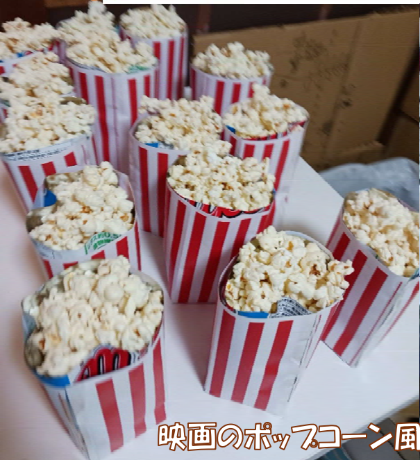
映画のポップコーン風

映画はミニオンズをみました！自分の座席チケットをもち入場するところから行い、映画を見ながらポップコーンのおやつを食べました。