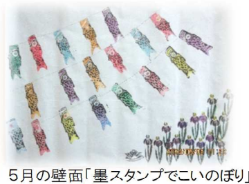
5月の壁面「墨スタンプでこいのぼり」

あじさいが少し色付いてきて、梅雨の近づきを感じます。この時期は「梅雨だる」と呼ばれる体のだるさや頭痛など、体の不調を感じる人も多いそうです。部屋を明るくしたりストレッチをする等で梅雨だるを吹き飛ばしましょう。