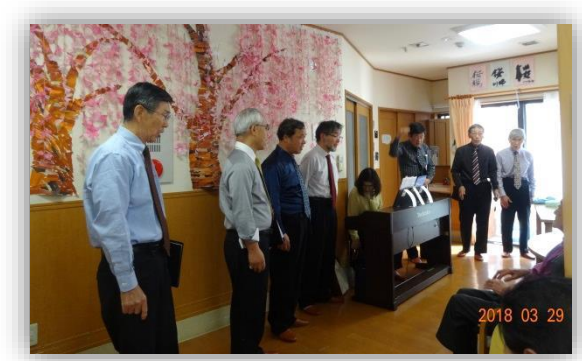
3/29(木)地域交流会で、男性コーラスグループ TUTTI によるコンサートを楽しみました♪