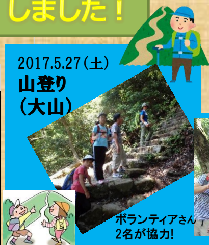
ボランティアさん2名が協力!