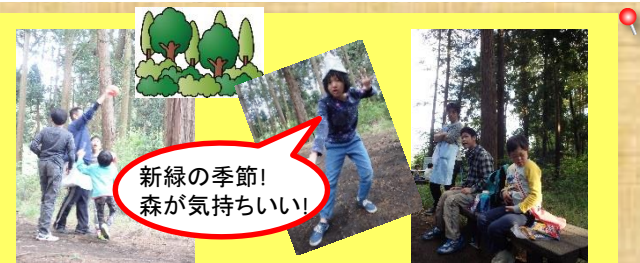
新緑の季節! 森が気持ちいい!