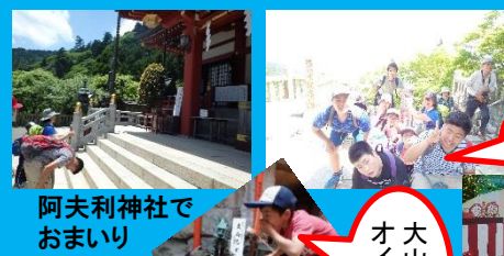
阿夫利神社でおまいり